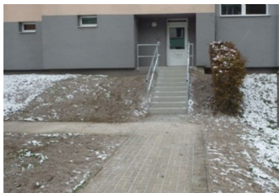
Nová schodiště na sídlišti