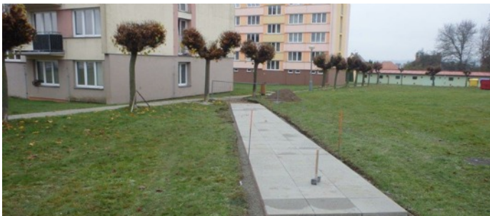
Nový chodník u školy