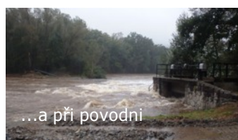
...a při povodni