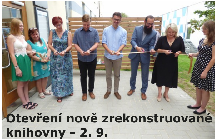
Otevření nově zrekonstruované knihovny - 2. 9.