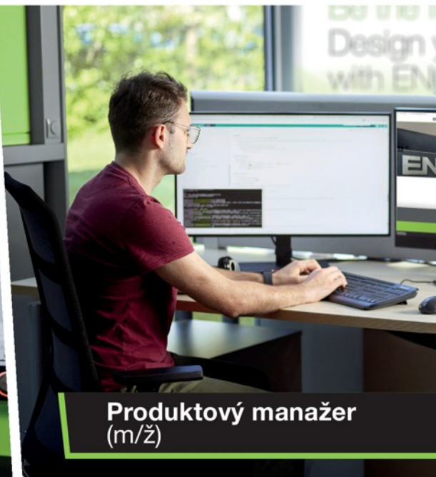
Produktový manažer (m/ž)