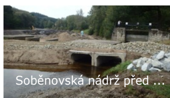
Soběnovská nádrž před ...