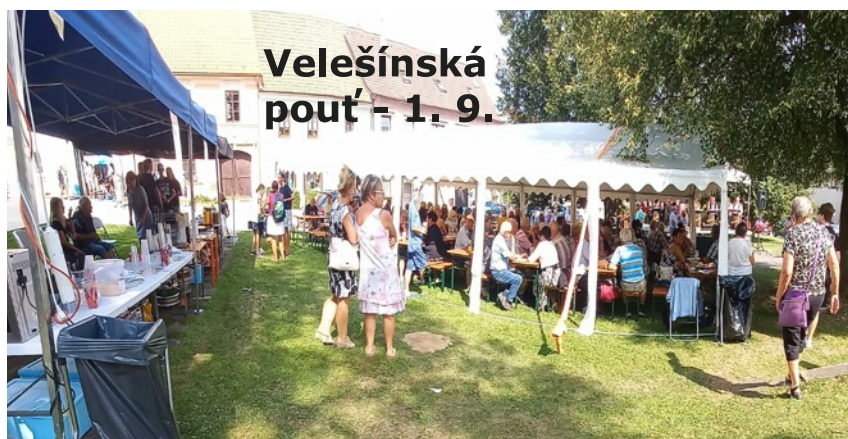
Velešínská pouť - 1. 9.