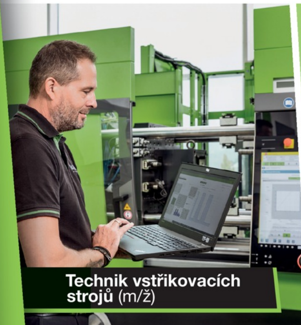
Technik vstřikovacích strojů (m/ž)

A staň se součástí světové jedničky ve výrobě vstřikovacích strojů.