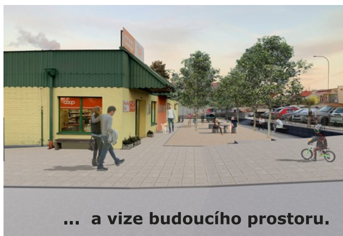
... a vize budoucího prostoru.