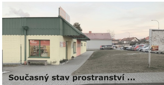
Současný stav prostranství ...

K drobným úpravám patří i instalace několika laviček. Budou na Budějovické, na náměstí, u stezky k podchodu nebo v Družstevní. Hotovo by mělo být koncem června. Je to první krok v postupném sjednocování mobiliáře, na kterém pracujeme. Od počátku června na zkoušku otevřeme hřiště za základní školou, které bylo řadu let pro veřejnost