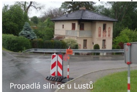
Propadá silnice u Lustů