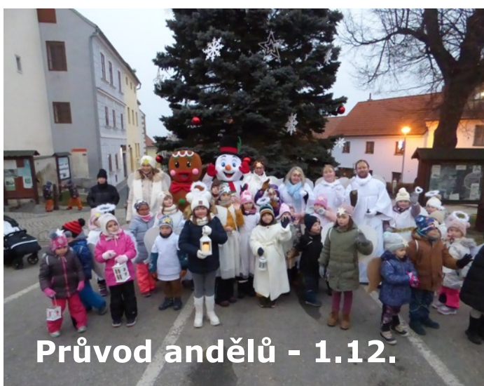
Průvod andělů - 1.12.