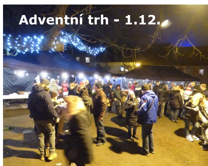
Adventní trh - 1.12.

Měsíční videožurnál - krátké reportáže z vybraných akcí najdete na www.kievelesin.cz a www.velesin.cz/zpravy-5/videozurnal/