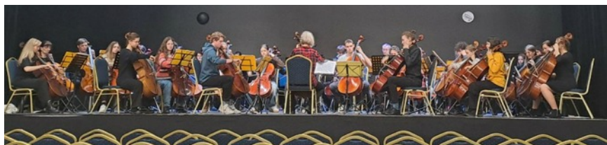
Koncert violoncellového orchestru, prosinec 2024