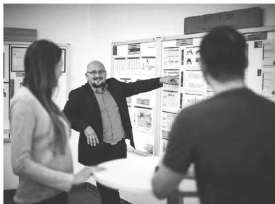
Zástupci oddělení kvality firmy ENGEL