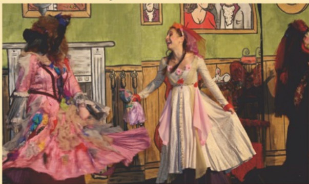
Představení „Ať žijí strašidla“