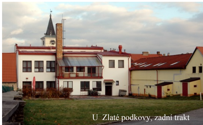
U Zlaté podkovy, zadní trakt