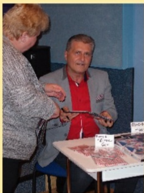
Koncert Marcela Zmožka 15.10.