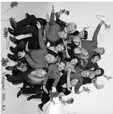
Vstupné: 300,- Kč

Pátek 2. prosince od 19 hodin v sále kina ve Velešíně