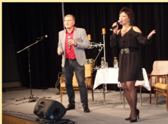
Koncert skupiny O5 A RADAČEK 7.10.