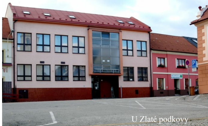
U Zlaté podkovy