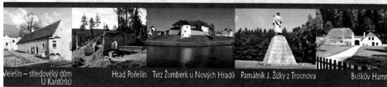
Velešín – středověký dům U Kantořků

Více informací naleznete na http://bit.ly/1XYhyg8 Soutěž probíhá od 1. července do 30. září 2016