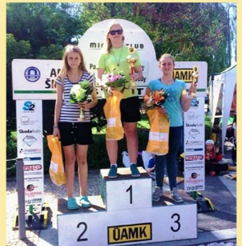
Minikáry foto k článku ve sportovní rubrice