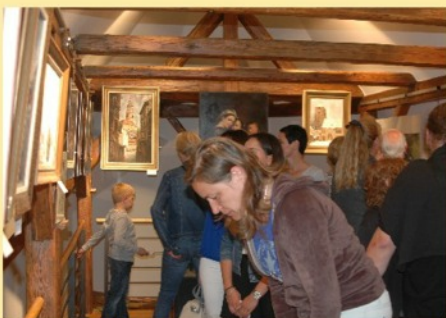
Výstava velešínských malířů a výtvarníků