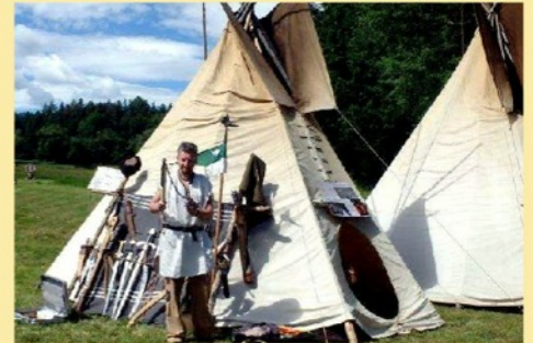
Ležení Lapků od Malše