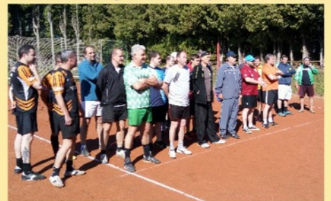
Nohejbalový turnaj trojic O pohár starosty města Velešín