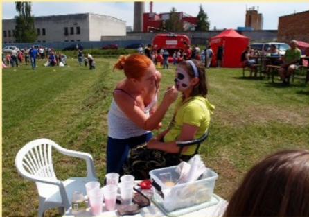
Dětský den na hřišti