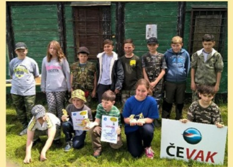
Rybářské závody mládeže Velešín