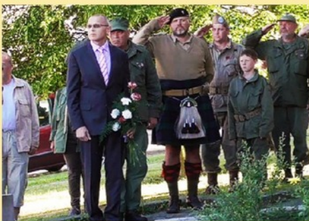
240 Miles to Freedom 2016