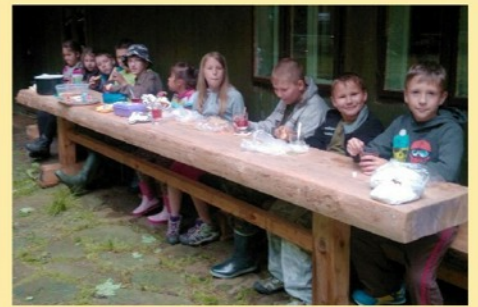
Haluzníci - rubrika „Spolky“