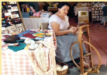
Den řemesel na Kantůrkovci a tradiční "Plackobraní"